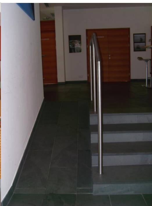
Rampe zur Behindertentoilette