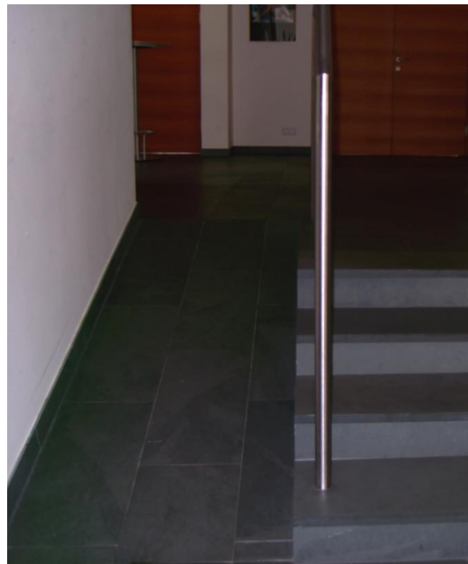
Rampe zur Toilette