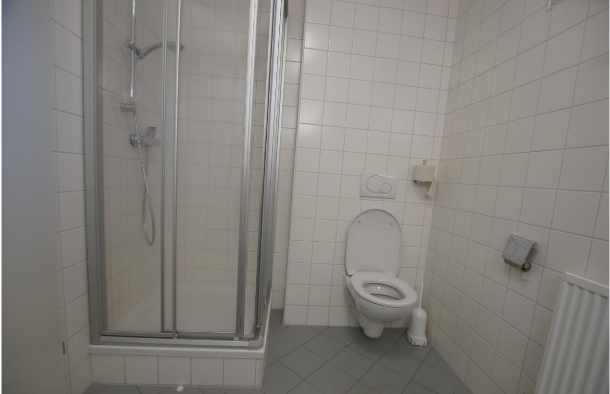
Toilette beim Speisesaal (Dusche wird vom Personal verwendet)